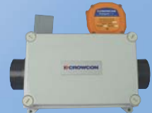
Probenentnahme- steuerung für Crowcons