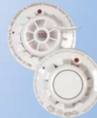
Bis zu 20 Feuer- /Hitze-detektoren pro Zone