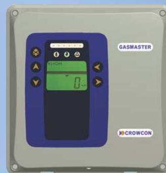
Gasmaster 1 Warnzentrale für einen Gasdetektor, eine Feuerzone oder eine Environmental Sampling Unit.